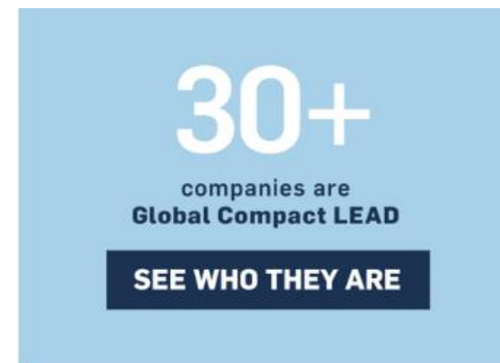
Fig. 4 LEAD 领军企业

联合国全球契约组织在 可持续金融投资 领域起到领导作用，促进投资机构对环境、社会和治理 (Environmental, Social and Governance, ESG) 的关注度与表现力，从而推动可持续发展在投资界和企业界成为主流，比如：贝莱德集团 (BlackRock) 于 2019 年宣布将公布在所有交易型开放式指数基金 (ETF) 中违反联合国全球契约十项原则的发行机构占比。