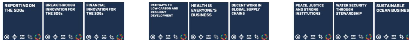
Fig. 2 行动平台

联合国全球契约组织的成员企业 (Participant) 有权自愿选择参加一个或多个 可持续发展行动平台 (Fig. 2)。这些行动平台不仅能够为拥有共同愿景的企业创造深度的合作机会，还可以使参与企业有机会成为行业先锋及影响者，通过行业指导、全球案例实践、技术创新等成果树立企业标杆。