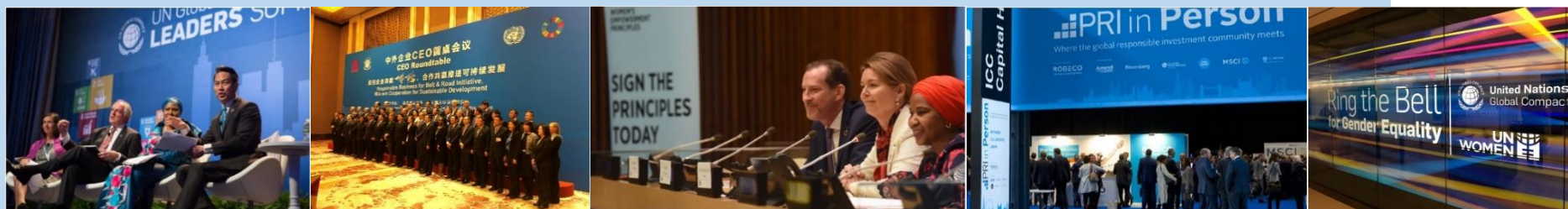
Fig. 1 成员权益